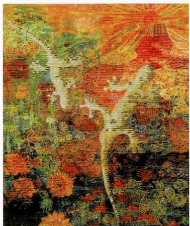
政岡 セツオ「ヤマトの夢」